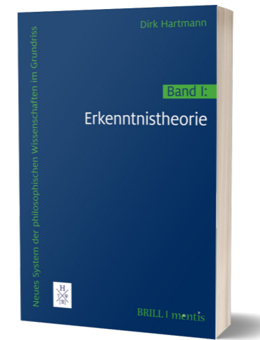
Im Oktober 2020 erschienen